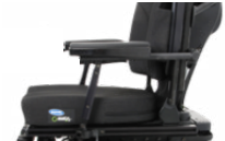
Ap. Braço Reclinável