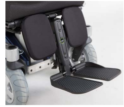
Ap. Pernas Central Elétrico LNX